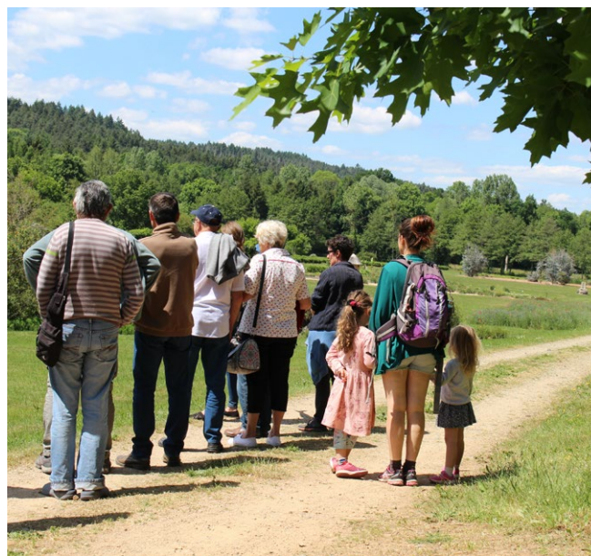
Visiteurs prêts au départ